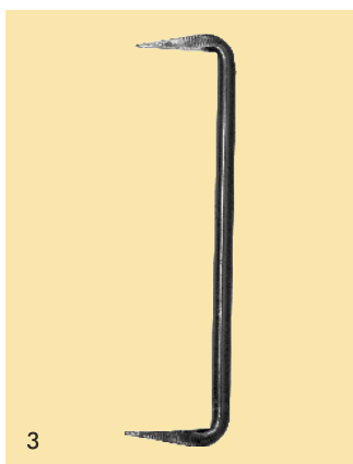
Gerüstklammern, Abb. 3