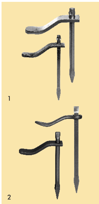
Mauerputzhaken (verstellbar), Abb. 1 und 2